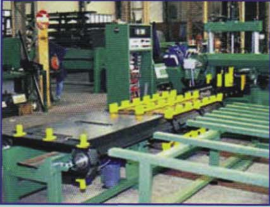
Descargador de cadenas

Algunos de los sistemas de carga "universales", pueden ser instalados en cualquier tipo de máquina, incluso las de otros fabricantes. El mismo diseño sirve para tubos, perfiles y macizos, a instalar en un número variable de estaciones de carga, gestión de despuntes, colas y retorno de las barras.