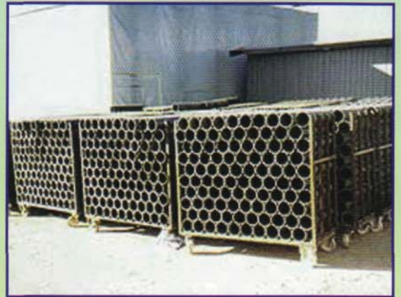
Descargador de contenedores