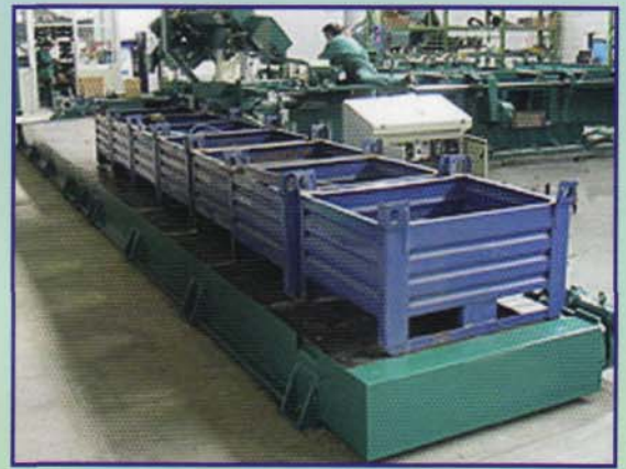
Descargador de contenedores